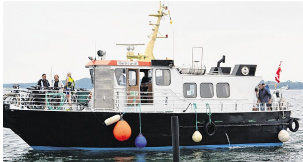
Das Motorschiff „Rødsand“ darf höchstens zwölf Passagiere befördern.