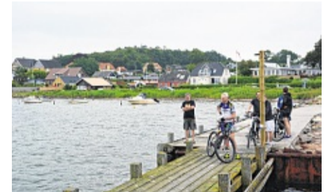
In Brunsnis warten weitere Passagiere.