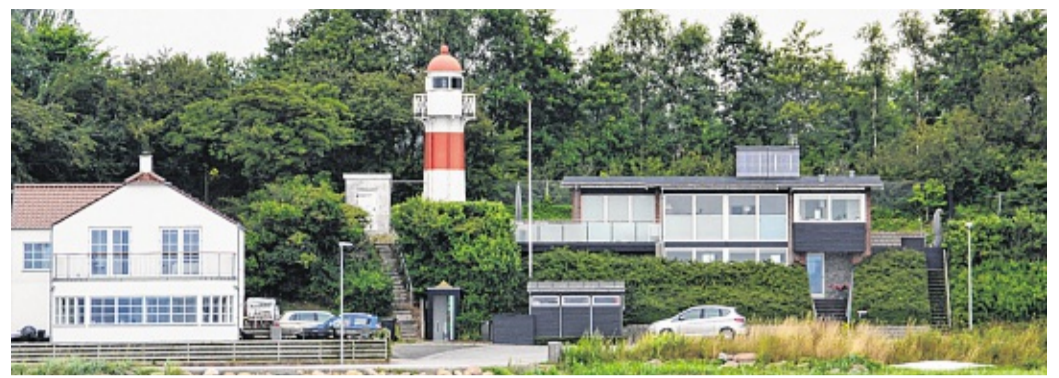
Einer von zwei Leuchttürmen entlang der Küste bei Ekensund