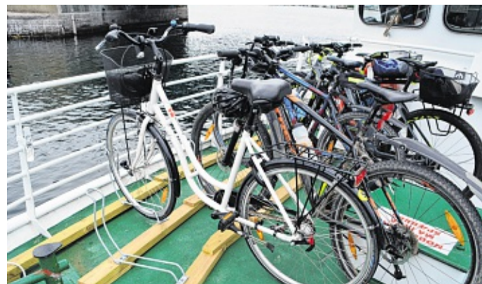
Der Fahrradständer ist selbst konstruiert.